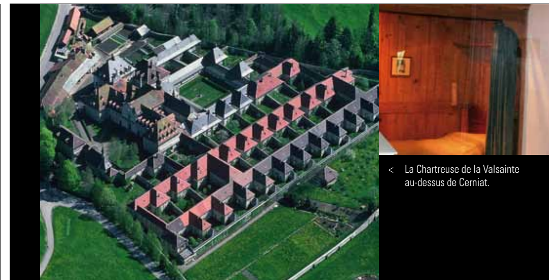
< La Chartreuse de la Valsainte au-dessus de Cerniat.

Au-dessus de Cerniat se situe la Chartreuse de la Valsainte, haut lieu de rayonnement spirituel. Les chartreux s'y sont installés en 1294 et, depuis plus de 700 ans, leur histoire est liée à celle de ce pays. Au-delà des siècles, elle relie les époques témoignant de leur pérennité, de leur sérénité.