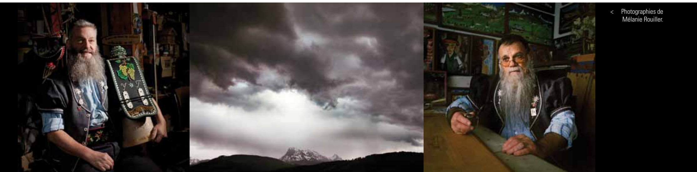
< Photographies de Mélanie Rouiller.

DE L'ARMAILLI AUX BARBUS ; PHOTOGRAPHIES DE MÉLANIE ROUILLER